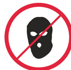
Kominiarki / balaclavas