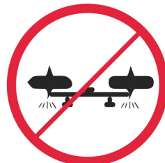
Drony / Drones