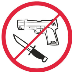
Broń, materiały wybuchowe, noże - przedmioty, których można użyć jako broń / weapons, explosives, knives, anything that could be adapted for use as a weapon