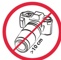
Profesjonalne aparaty fotograficzne, kamery wideo / professional photo cameras, video cameras