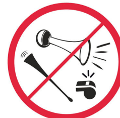
Wuwuzele, trąbki, urządzenia emitujące dźwięk / vuvuzelas, trumpets, devices emitting a sound