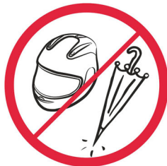
Kaski, parasolki z ostrym zakończeniem / helmets, umbrellas with sharp points