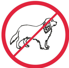
Zwierzęta / animals