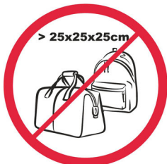
Pudła, torby, plecaki, walizki i inne wszelkie przedmioty większe niż 25x25x25 cm / items larger than 25x25x25 cm