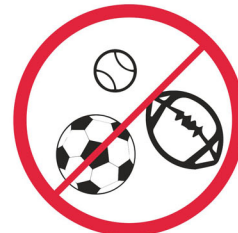
Piłki sportowe, plażowe, inne / Balls