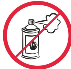
Gaz w aerozolu, substancje żrące, łatwopalne, barwniki / aerosol sprays, corrosive, flammable materials, colorants