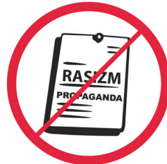
Materiały rasistowskie, ksenofobiczne, polityczne, religijne, propagandowe, prowokacyjne / political, religious, propaganda, provocative materials etc.