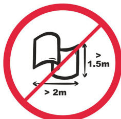
Banery lub flagi o wymiarach większych niż 2.0 m x 1.5 m. / flag size max. 2.0 m x 1.5 m