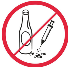
Napoje alkoholowe, narkotyki, substancje pobudzające, psychotropowe / alcohol drinks, drugs, stimulants or psychotropic substances