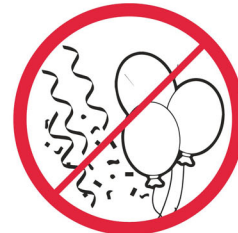
Balony, serpentyny, konfetti / Balloons, streamers, confetti