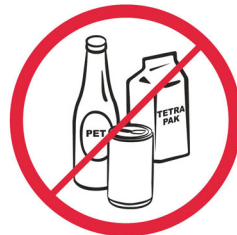
Butelki, puszki, kubki, dzbanki, opakowania PET, szklane / bottles, cups, jugs, cans, objects made from PET, glass