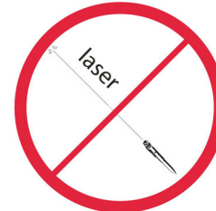
Wskaźniki laserowe / laser pointers