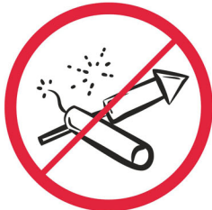
Materiały pirotechniczne / pyrotechnics