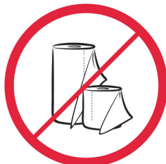
Rolki papieru, duże ilości papieru / paper rolls, large quantities of paper