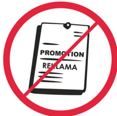
Przedmioty, materiały komercyjne i promocyjne / promotional or commercial objects or materials